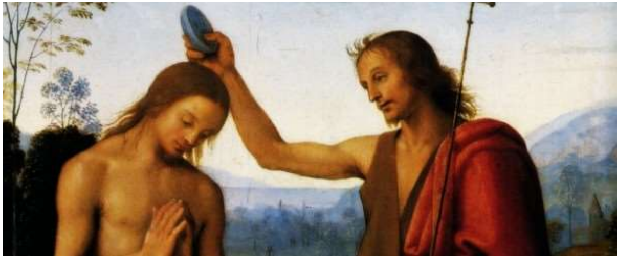
Opera di Pietro Perugino